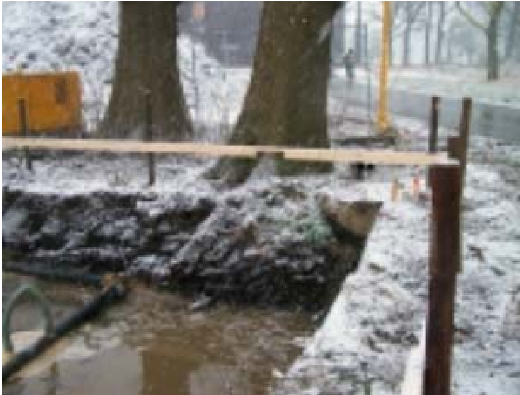
Bij het uitgraven voor de fundering zijn de wortels van deze monumentale eik vernield

Aannemers maken er wel vaker een potje van. Twee jaar geleden was een rij lindes aan de Brinkstraat bij wegwerkzaamheden op eilandjes hoog boven de omgeving komen te staan. Daardoor stonden ze min of meer los en zouden bij een flinke storm gemakkelijk omwaaien. Hetzelfde is in 2007 gebeurd bij de bomen die langs de landelijke Engerinksweg stonden. Deze rij was opgenomen in het inrichtingsplan van park en villawijk als herinnering aan het oude landschap. Helaas overleven ook deze bomen de rigoureuze aanpak door de aannemer niet. Om dergelijke problemen te voorkomen is het nodig te zorgen voor goed toezicht tijdens het werk. Het moet duidelijk zijn welke afdeling en welke persoon hierbij verantwoordelijk is. Bovendien schept een degelijk, niet opzij te zetten of te openen hekwerk op een flinke afstand van de stam duidelijkheid.